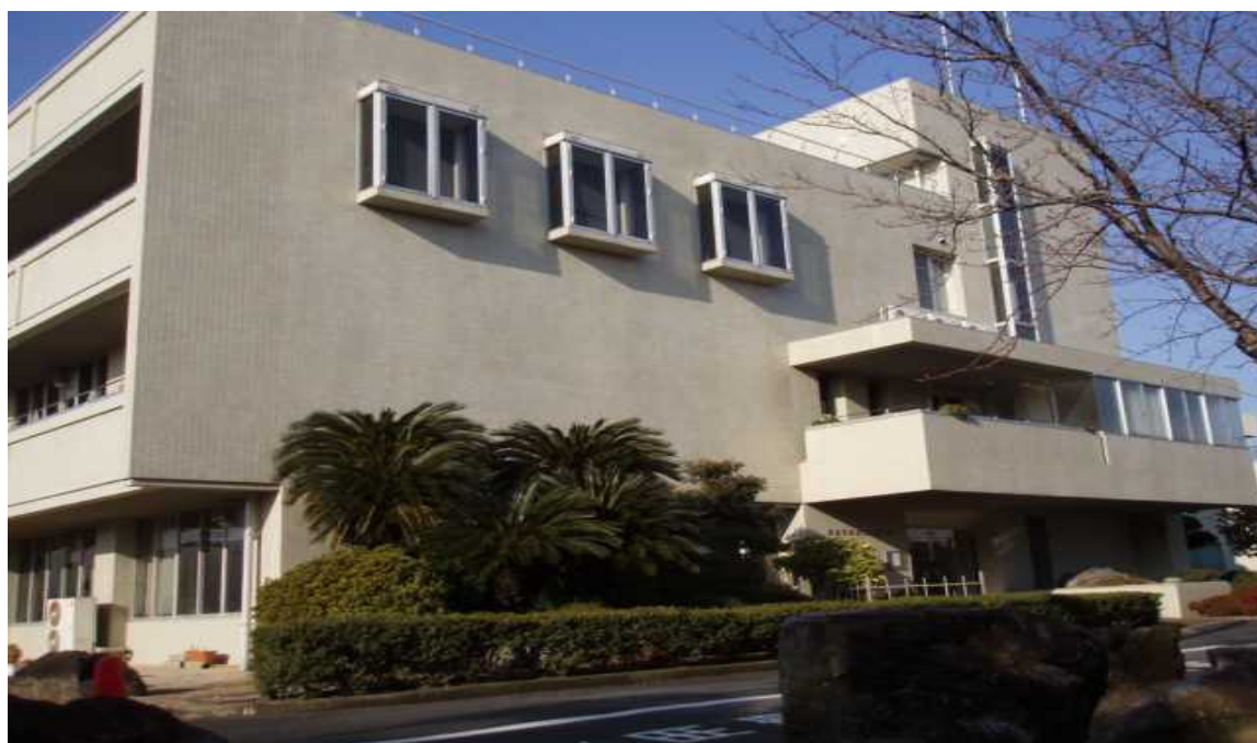
岡山県南部水道企業団 庁舎